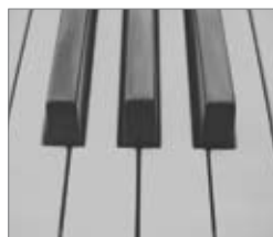
Contraste ANSI bas

Prenez garde en lisant les caractéristiques du contraste! Un projecteur affichant un contraste, par exemple, de 10 000:1 peut avoir un contraste ANSI beaucoup plus bas que celui du HD67. Les contrastes sont des données reflétant la technique "Full on, Full Off". Cette dernière calcule la différence entre un écran tout blanc et un écran tout noir. Nombreux sont ceux qui considèrent que cette technique n'est pas représentative du monde "réel" et n'offre donc pas des informations judicieuses pour apprécier la façon dont le projecteur fonctionnera chez vous. C'est pour cette raison que si vous souhaitez comparer des contrastes entre différents projecteurs, il est préférable de comparer les contrastes ANSI.