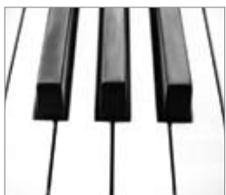
Contraste ANSI élevé

Le contraste ANSI 1 est une façon de mesurer la performance du contraste en "version réelle" que vous pouvez obtenir chez vous. Cette technique inclut une procédure qui peut être ré-utilisée afin de comparer la performance entre des projecteurs qui n'utilisent pas la même technologie. Grâce à un contraste ANSI bien plus élevé que sur la plupart des projecteurs DLP, le HD600X est le choix privilégié des puristes du home cinéma !